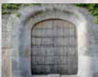
Obriu les portes a la festa!

A tothom, en nom del Consistori i en el meu propi vos desig de tot cor unes bones festes patronals de Sant Llorenç. Que per molts d'anys ens hi trobem.