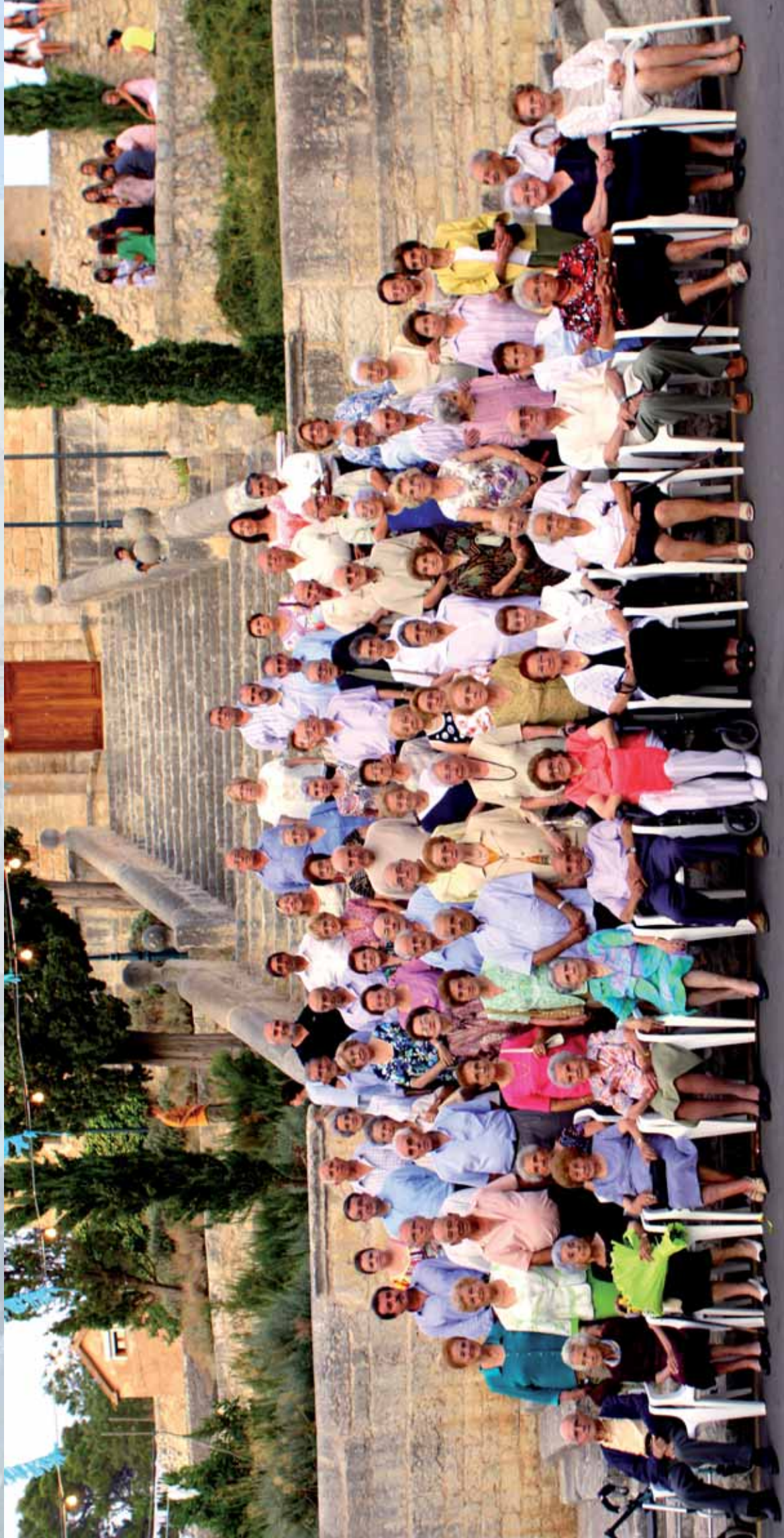
Festes Patronals Sant Llorenç 2009