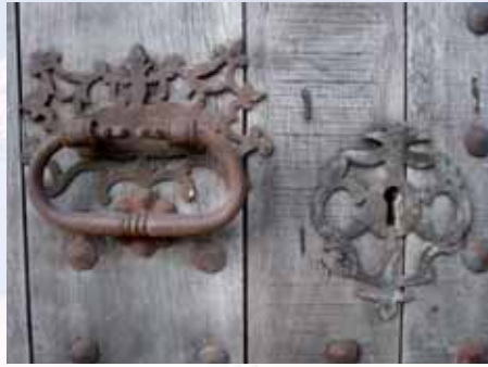
Cridats i convidats a festa!

SELVA celebra des de temps immemorial les festes patronals en honor a Sant Llorenç, tradició que el poble conserva ben viva. Perquè la festa, per ésser vertadera i autèntica, ha de néixer del poble i s'ha de fer des del poble. És el motiu per al qual feim crida per a la participació dels selvatgins i selvatgines i la benvinguda a tots els que aquests dies s'acostin a Selva, especialment als veïnats de Caimari, Moscarí, Biniamar i Binibona.