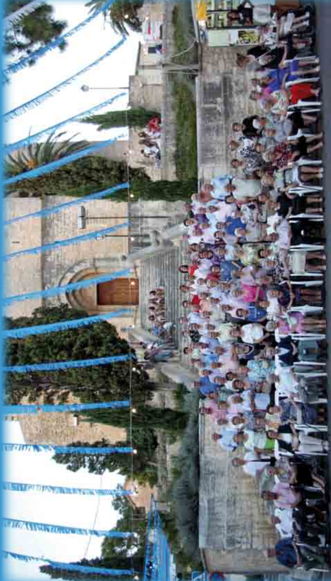
La gent major de Selva. Agost 2011